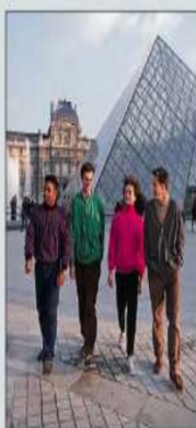
Le Louvre et sa pyramide, symboles du passé et de l'avenir.

Ruinée par la guerre, la France reconstruit son économie. La construction de la France moderne passe par deux étapes importantes.